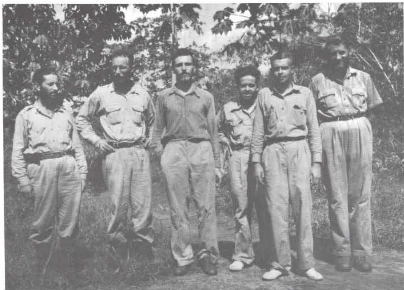
Comisión Inglesa para el estudio del Cacao: Amazonas Río Kuduyarí (Agosto a Diciembre 1952).

Merece, también, especial mención como estudio sistemático del doctor Richard E. Schultes el verificado sobre el género Herrania , de la familia Sterculiaceae , cuya investigación dio resultados muy interesantes, como el descubrimiento de varias especies entonces desconocidas. Se trata de plantas americanas principalmente de las selvas amazónicas; sólo unas pocas son del interior del país, de climas medios como la Herrania laciniifolia Goudot, que encontré en el año de 1939 en los cafetales de la