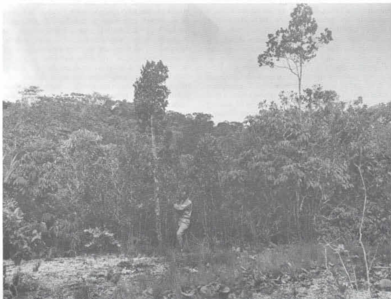
Doctor Richard Evans Schultes examinando la Hevea nitida (Sabana de Jisijisimo - Vaupés).

cación a las tierras colombianas, que sólo abandonaba para viajar a Boston y visitar a sus padres, recoger el correo y ordenar sus trabajos escritos en la selva sobre sus rodillas, para publicarlos, ya en el "Botanical Museum Leaflets", de la Universidad de Harvard, publicación de la cual fue su Editor desde 1957, ya en otras revistas científicas como Economic Botany , Lloydia , Caldasia y Mutisia , de Estados Unidos las primeras y de Colombia las dos últimas. Igualmente, aprovechaba sus salidas de la selva colombiana para ordenar, clasificar y rotular en el Museo Botánico de Harvard su inmensa colección de plantas (hasta hace poco, más de veinte mil especímenes o números botánicos) que por quintuplicado recogía en la selva para sendos envíos a otras instituciones científicas, con el fin de enriquecer sus Herbarios, sin olvidar, claro está, el nuestro al que le tenía preferencia y que guarda valiosos especímenes "autóctonos" de la flora Amazónica, tan escasamente representada en el Herbario Nacional Colombiano. Debido a que con el doctor Schultes coleccionábamos hasta doce duplicados de la misma planta, ésta quedaba debidamente representada en los principales herbarios del mundo, para facilitar el estudio de especialistas en determinados grupos (familias) de plantas que pueden ofrecer cambios morfológicos según el hábitat, como consta en diversos estudios realizados. Del acervo de estos