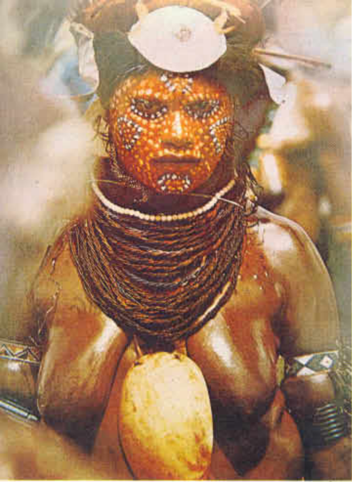
FIGURA Nº 7. Máscara ornamental.