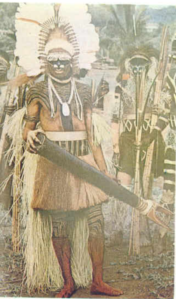
FIGURA Nº 2. Shaman.