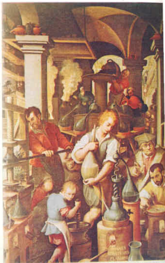
FIGURA Nº 5. Alquimia.