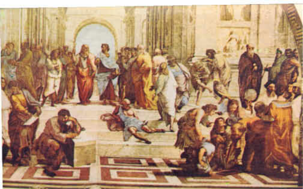
FIGURA Nº 4. "La Escuela de Atenas", de Rafael.