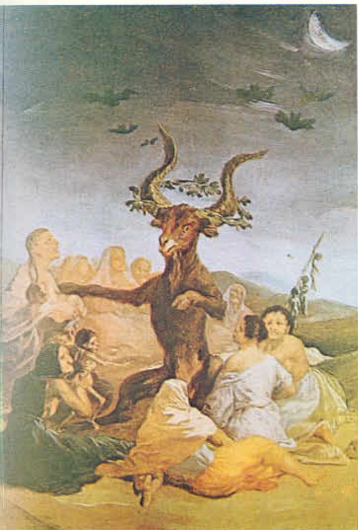
FIGURA Nº 10. El Aquelarre - Goya.