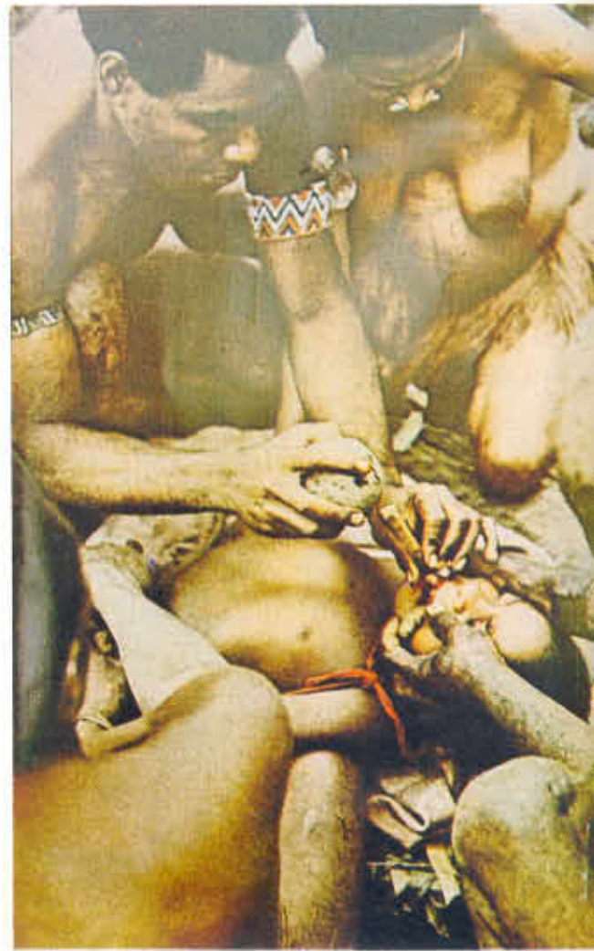
FIGURA Nº 8. Cirugía primitiva en pueblos primitivos actuales.