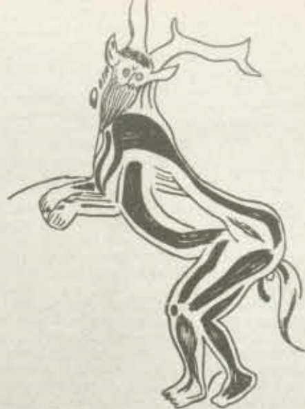
FIGURA Nº 1. Hombre Ciervo. Caverna de los Trois Frères. Francia.