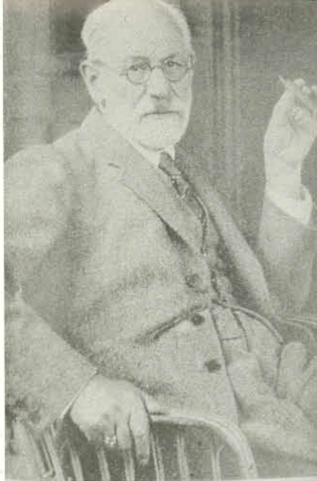
FIGURA Nº 11. Sigmund Freud.