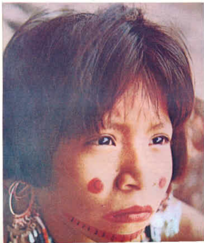
FIGURA Nº 6. Indígena actual del Chocó.