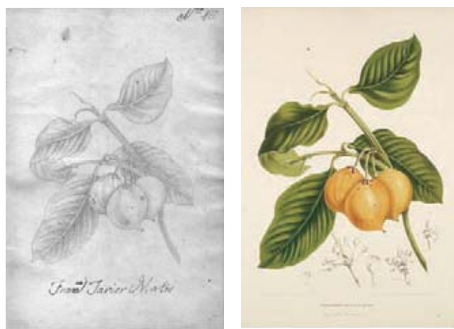
Figura 12. Garcinia dulcis (Roxb.) Kurz, Clusiaceae. Izquierda, boceto a lápiz atribuido a Matís, derecha lámina No. 15 de Fleurs, Fruits et feuillages choisis de L'île de Java , pintura de Berthe Hoola van Nooten.