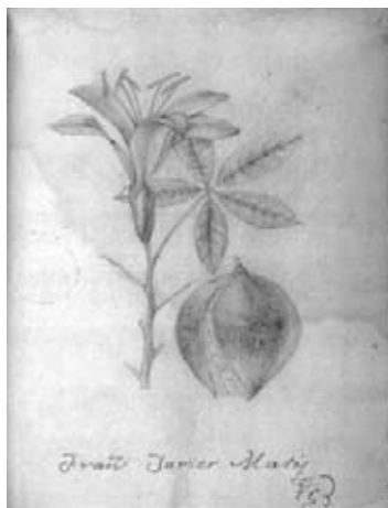
Figura 1.- Ceiba schottii Britten & Baker f. vel aff. Bombacaceae. Boceto a lápiz en pequeño formato atribuido a Francisco Javier Matis.

4.- Bromeliaceae. Tillandsia turneri Baker. El boceto, con la firma de Matis coincide plenamente con el diseño de la lámina policroma distinguida con el número 306, la cual carece de la firma del autor. De esta especie existe además la réplica en negro (306a) que serviría de modelo al grabador. (Figura 4).