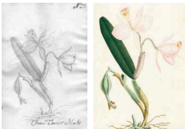
Figura 9.- Cattleya trianae Lindl. & Rchb. Orchidaceae. Izquierda, boceto a lápiz atribuido Matís, derecha lámina No. A-428 en folio mayor de la Colección Mutis (Archivo del Real Jardín Botánico, CSIC, Madrid).

10.- Maranthaceae. Calathea insignis Peters. El dibujo a lápiz coincide con la lámina policroma en folio mayor distinguida con el número 604. Es esta una de las láminas en las cuales fueron añadidos en la parte inferior los dibujos anatómicos. Carece de la firma de su autor, al igual que la réplica