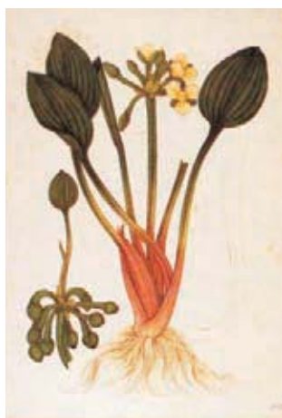
Figura 2.- Limnocharis flava (L.) Buch. Hydrocharitaceae. Izquierda, boceto a lápiz atribuido a Matis, derecha lámina No. A-234 en folio mayor de la Colección Mutis (Archivo del Real Jardín Botánico, CSIC, Madrid).