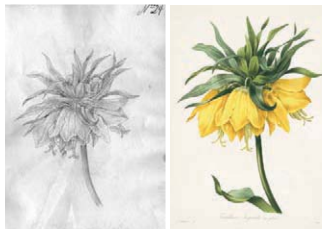
Figura 13.- Fritillaria imperialis L. Liliaceae. Izquierda, boceto no. 24 atribuido a Matís. Derecha, Imagen tomada de la lámina no. 2 de Choix des plus belles fleurs et de plus belles fruits , obra de Pierre Joseph Redouté.