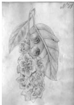
Figura 15.- Boceto No. 17, dibujo atribuido a Matís. Especie indeterminada. La planta representada no corresponde a la flora nativa colombiana y posiblemente fue copiada de un libro de jardinería editado en Europa.