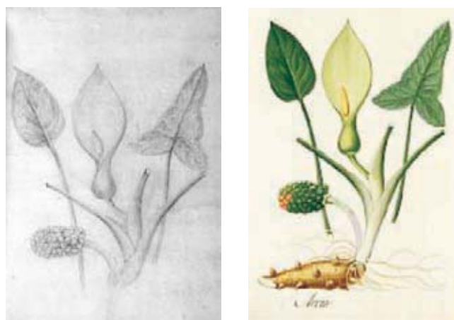
Figura 11.- Araceae. Izquierda, boceto a lápiz atribuido a Matís, derecha, lámina en folio mayor, distinguida con el No. A- 612 de la Colección Mutis. (Archivo del Real Jardín Botánico, CSIC, Madrid).

11.- Araceae. Xanthosoma cf. El dibujo coincide con la lámina distinguida con el número 612. Se trata de una imagen policroma de la autoría de Matís y que representa una aráce. Fue marcada como Arum y en ella están representados dos tipos de hojas aparte de una infrutescencia, además de la inflorescencia que aparece en la parte superior. La lámina en folio mayor lleva además un rizoma con sus yemas y raíces que no aparecen en el boceto. De la inflorescencia y de la