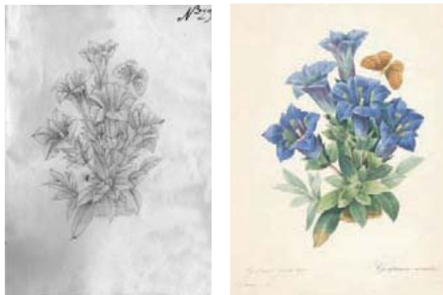
Figura 21.- Gentiana acaulis L., Gentianaceae. Izquierda, boceto no. 29 atribuido a F. J. Matís. Derecha Lámina no. 97 de la obra Choix des plus belles fleurs et de plus belles fruits , de Pierre Joseph Redouté.

21.- Boceto No. 29. Gentianaceae. Gentiana acaulis L., planta de origen europeo. Corresponde a una copia de la Lámina 97 de la obra Choix des plus belles fleurs et des plus belles fruits de Pierre Joseph Redouté (1827-1833). En la lámina se incluye la representación de un lepidóptero el cual fue copiado burdamente. (Figura 21).