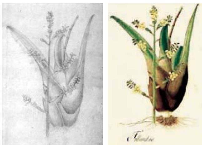
Figura 5.- Racinaea subalata (André) M.A.Spencer & L.B. Smith. Bromeliaceae. Izquierda, boceto a lápiz atribuido a Matís, derecha lámina No. A-307 en folio mayor de la Colección Mutis (Archivo del Real Jardín Botánico, CSIC, Madrid).