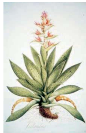
Figura 3.- Tillandsia biflora Ruiz & Pav. Bromeliaceae. Izquierda, boceto a lápiz atribuido a Matis, derecha lámina No. A-299 en folio mayor de la Colección Mutis.