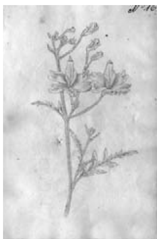
Figura 14.- Boceto No. 16 atribuido a Matís. Figura indeterminada con apariencia de Papaveraceae. La especie representada no corresponde a la flora nativa colombiana y posiblemente fue copiada de un libro de jardinería editado en Europa.

13.- Boceto No. 16. Indeterminada. Recuerda a alguna Papaveraceae. Probablemente la representación de alguna lámina de una obra de jardinería publicada. (Figura 14).