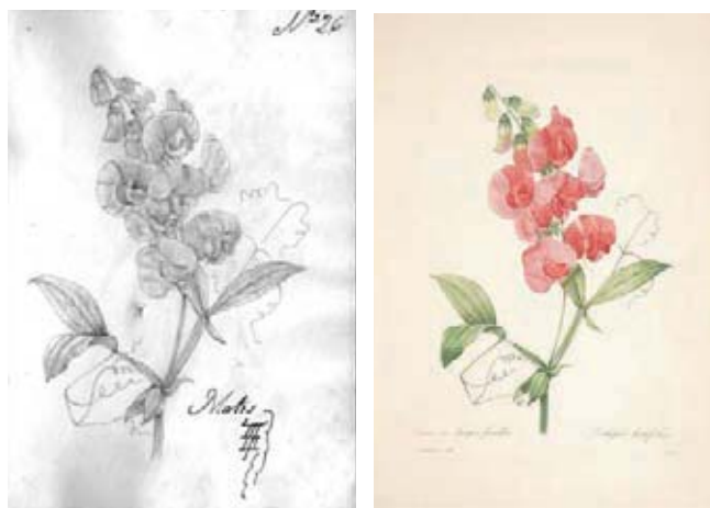
Figura 18.- Lathyrus latifolius L., Fabaceae. Izquierda Boceto no. 26 atribuido a Matís. Derecha, Lámina no. 2 de Choix des plus belles fleurs et de plus belles fruits , obra de Pierre Joseph Redouté.