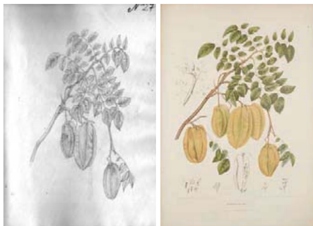
Figura 19.- Averrhoa carambola L., Oxalidaceae. Izquierda, boceto no. 27 atribuido a Matís. Derecha Lámina no 36 de la obra Fleurs, Fruits et feuillages choisis de L'île de Java , de Berthe Hoola van Nooten.

19.- Boceto No. 27. Oxalidaceae. Averrhoa carambola L., planta de origen Indomalayo introducida a América y las Antillas. Corresponde a una parte de la lámina nº 36 de la obra: Fleurs, fruits et feuillages choisis de l'île de Java: peints d'après nature . (van Nootenv, 1880), donde esta planta aparece con el nombre de Averrhoa bilimbi L. (Figura 19).