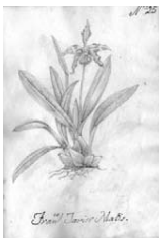
Figura 17.- Boceto no. 25 atribuido a F.J. Matís. Odontoglossum sp. Orchidaceae.

18.- Boceto No. 26. Fabaceae. Lathyrus latifolius L., planta de origen euroasiático. Corresponde a una copia de la Lámina 98 de la obra Choix des plus belles fleurs et de plus belles fruits de Pierre Joseph Redouté (1933). (Figura 18).