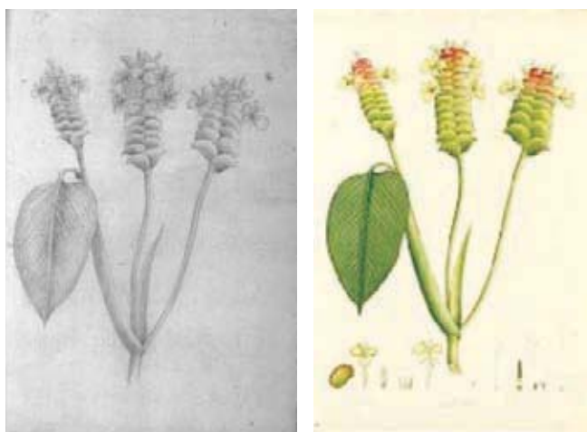
Figura 10.- Calathea insignis Peters. Maranthaceae. Boceto a lápiz atribuido a Matís. Derecha, lámina No. A-604 en folio mayor de la Colección Mutis.