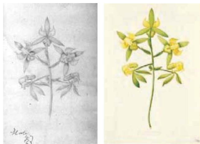
Figura 7.- Coryanthes summeriana Lindl. Orchidaceae. Izquierda, boceto a lápiz atribuido Matís, derecha lámina No. A-458 en folio mayor de la Colección Mutis (Archivo del Real Jardín Botánico, CSIC, Madrid).