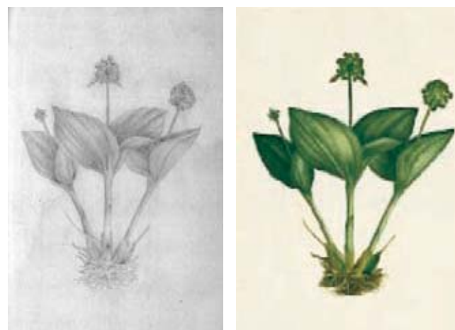
Figura 8.- Malaxis parthonii Morr. Orchidaceae. Izquierda, boceto a lápiz atribuido Matís, derecha lámina No. A-579 en folio mayor de la Colección Mutis (Archivo del Real Jardín Botánico, CSIC, Madrid).

mayor, que carece de la firma de su autor, le fue añadida otra planta con los frutos que no figura en el dibujo a lápiz y por ello el diseño de las raíces se modificó. El boceto carece de firma. (Figura 6)