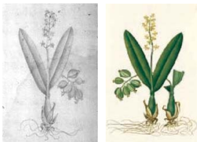
Figura 6.- Prosthechea vespa (Vell.) W.E. Higgins, Orchidaceae. Izquierda, boceto a lápiz atribuido a Matís, derecha lámina No. A-415 en folio mayor de la Colección Mutis (Archivo del Real Jardín Botánico, CSIC, Madrid).