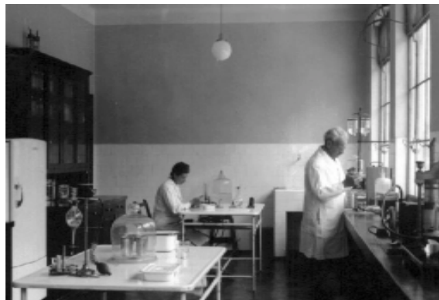
Foto 8. Vista general del laboratorio del Parque de vacunación.

Esa destreza manual y el ingenio que caracterizaron al director fueron factor decisivo para el éxito de las tareas del Parque, porque a falta de herramientas para la producción de la vacuna, el científico hubo de inventarlas y fabricarlas: así ocurrió con el “escarificador”, que reemplazó los cuchillos corrientes que se usaban para hacer los cortes en las terneras, facilitó la operación y permitió un mayor número de siembras de vacuna. Otros elementos