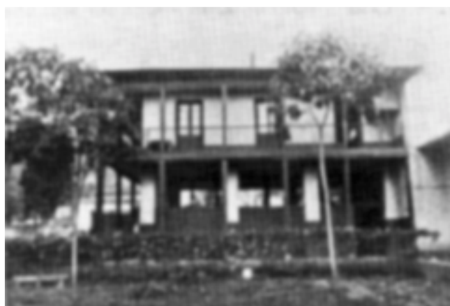
Foto 3. Sede del Parque de vacunación en la Avenida Caracas de Bogotá.

La viruela –traída a América a partir de la Conquista, por los negros africanos y los blancos europeos– arremetió contra los indígenas, cuyos organismos carecían de defensas frente a un mal desconocido. Comenzó así una