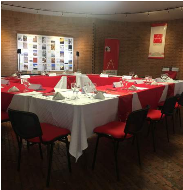
Aspecto del salón antes del comienzo de la reunión.

Reunión mensual del Colegio Máximo de las Academias de Colombia realizada el jueves 4 de agosto de 2016 en la sede de la Sociedad Colombiana de Arquitectos.