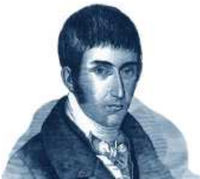
Imagen de la publicación Papel Periódico Ilustrado procesada gráficamente con cambios de orientación, de tonos de color y de textura respecto al original.

Universidad Distrital Francisco José de Caldas