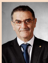
Dr. Serge Haroche